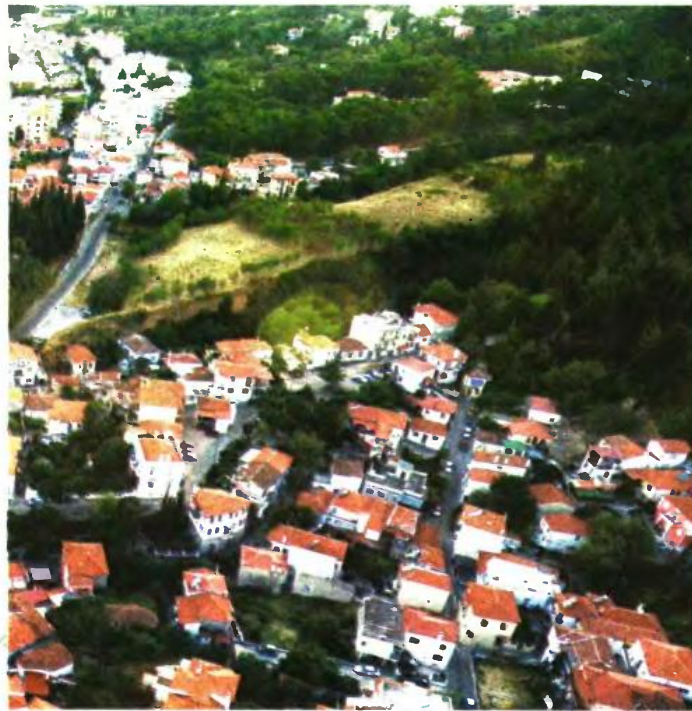
ΓΥΛΙΝΟΝ ΤΕΑΥΜΒΕΡΒΕΙΔΗΣ ΒΑΣΙΛΗΣ

πολέμου ή των θυμάτων πολέμου ή των αναπήρων που υπέστησαν βλάβη κατά την εκτέλεση της υπηρεσίας τους.