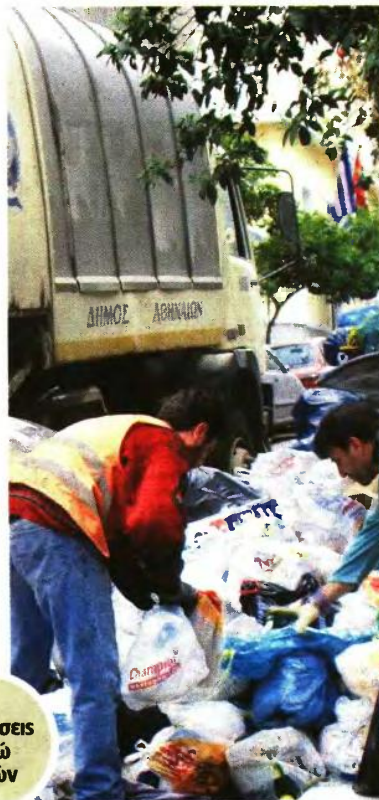
Με συμβάσεις οκτώ μηνών

από δημόσια Αρχή, στα γραφεία της υπηρεσίας στην ακόλουθη διεύθυνση: Δήμος Αθηναίων, Λισίων 22, Αθήνα, Γραφείο Πρωτοκόλλου, Διεκπεραίωσης και Αρχείου 2ος όροφος, είτε ταχυδρομικά με συστημένη επιστολή στα γραφεία της υπηρεσίας στην ακόλουθη διεύθυνση: Δήμος Αθηναίων, Λισίων 22, Τ.Κ. 10438, Αθήνα, απευθύνοντάς τη στη Διεύθυνση Διαχείρισης και Ανάπτυξης Ανθρώπινου Δυναμικού, Τμήμα Προσωπικού Ιδιωτικού Δικαίου (τηλ. επικοινωνίας: 2105277450, 2105277480, 2105277452, 2105277484, 2105277509, 2105277510, 2105277514, 2105277516, 2105277520). ■