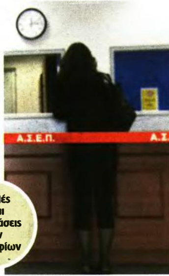
ΘΕΜΑ ΜΕ ΤΗΝ ΕΡΩΤΗΣΗ 29