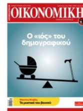
Λιγότεροι γάμοι - λιγότερα παιδιά