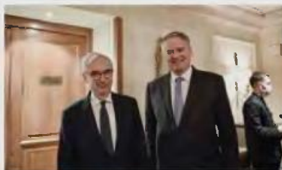
Ο γενικός γραμματέας του ΟΟΣΑ Ματίας Κόρμαν με τον μόνιμο αντιπρόσωπο της Ελλάδας στον ΟΟΣΑ, καθηγητή Γιώργο Πρεβελάκη.

Τελευταία ερώτηση: η Ελλάδα πού κολλάει σ' αυτή τη συζήτηση; Πώς και ανακαλύπτει ο ΟΟΣΑ την Ελλάδα –και μάλιστα την Κρήτη, τα Χανιά–για να φιλοξενήσει τη συζήτηση του (πλανητικού, όντως) ζητήματος