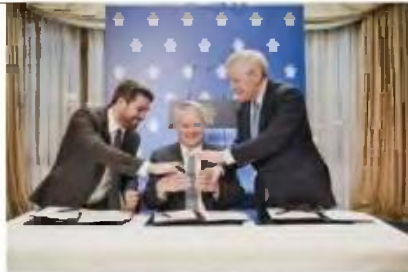
Ο δήμαρχος Χανίων Παναγιώτης Σημανδράκης, με τον γενικό γραμματέα του ΟΟΣΑ Ματίας Κόρμαν και τον πρόεδρο του Οικονομικού Φόρουμ των Δελφών Συμεών Τσομώκο, υπογράφουν το μνημόνιο συνεργασίας.

πληθυσμών του κόσμου, και ο δεύτερος το «Ετήσιο Συνέδριο Κρήτης για τον Διάλογο για τον Πληθυσμό, που θα φιλοξενηθεί στα Χανιά, σε συνεργασία με το Οικονομικό Φόρουμ Δελφών», όπως χαρακτηριστικά επισήμανε ο κ. Κόρμαν κατά τη διάρκεια της επίσκεψής του στη χώρα μας.