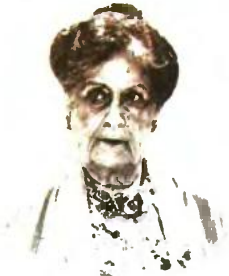
Της ΜΑΡΙΑΣ ΝΕΓΡΟΠΟΝΤΗ-ΔΕΛΙΒΑΝΗ

Σ ήμερα, η Ελλάδα σφικτοδένει το βαρύτατο πένθος της για τον άδικο χαμό 57 ψυχών με την ξεχειλιζούσα οργή της για το προαναγγελθέν σιδηροδρομικό έγκλημα. Παραμονές εκλογών καταγγέλλει προς πάσα κατεύθυνση τις φρικιαστικές συνέπειες της προχωρημένης σήψης των τελευταίων δεκαετιών που το προκάλεσε. Πρόκειται για: