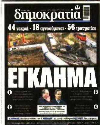
Το πρωτοσέλιδο της «δημοκρατίας»