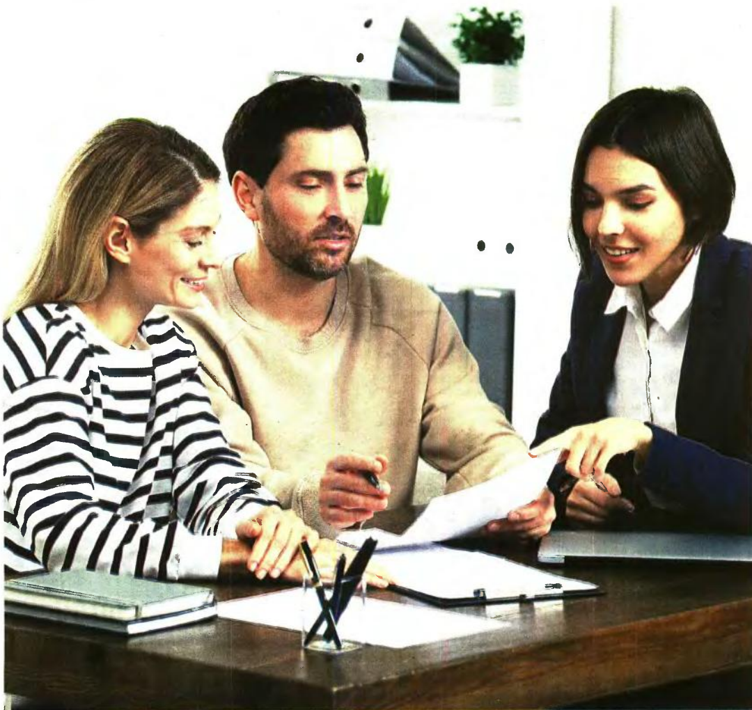
Η συγκέντρωση των δικαιολογητικών για μεταβιβάσεις ακινήτων θα πραγματοποιείται από τον συμβολαιογράφο.

Η βεβαίωση αναζητείται αυτεπάγγελτα από τον συμβολαιογράφο ή