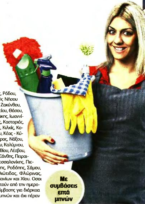
Με σύμβαση επτά μηνών

Δράμας, Δυτικής Αττικής, Ρόδου, Κω, Καρπάθου - Ηρωικής Νήσου Κάσου, Εβρου, Ευβοίας, Ζακύνθου, Ηλείας, Ημαθίας, Ηρακλείου, Θάσου, Θεσπρωτίας, Ικαρίας, Ιθάκης, Ιωαννίνων, Καβάλας, Καρδίτσας, Καστοριάς, Κέρκυρας, Κεφαλληνίας, Κιλκίς, Κοζάνης, Κορινθίας, Λήμνου, Κέας - Κύθου, Τήνου, Σύρου, Θήρας, Νάξου, Ανδρου, Μυκόνου, Μήλου, Καλύμνου, Λακωνίας, Λάρισας, Λασιθίου, Λέσβου, Μαγνησίας, Μεσσηνίας, Ξάνθης, Πειραιώς - Νήσων, Πέλλας, Θεσσαλονίκης, Πιερίας, Πρέβεζας, Ρεθύμνης, Ροδόπης, Σάμου, Σερρών, Τρικάλων, Φθιώτιδας, Φλώρινας, Φωκίδας, Χαλκιδικής, Χανίων και Χίου. Όσοι προσληφθούν θα εργαστούν από την ημερομηνία υπογραφής της σύμβασης για διάρκεια απασχόλησης επτά (7) μηνών και όξι βέραν της 31.12.2023. ■