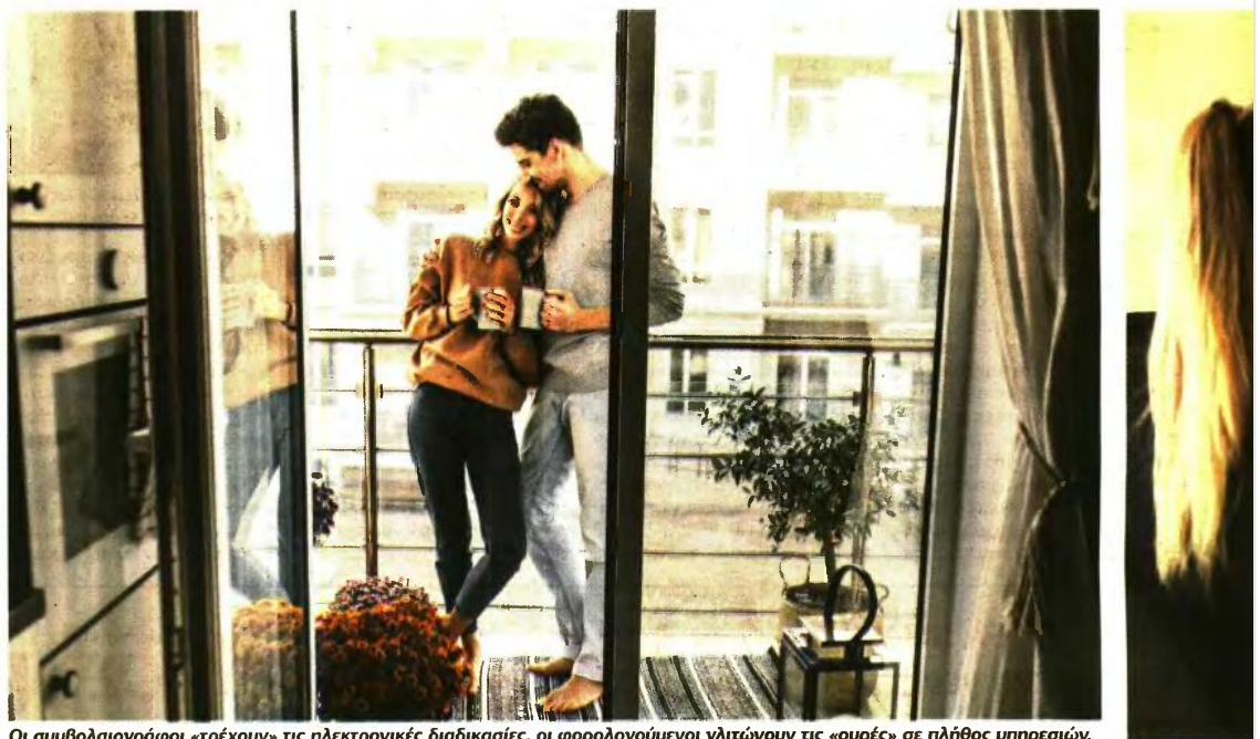
Οι συμβολαιογράφοι «τρέκουν» τις ηλεκτρονικές διαδικασίες, οι φορολογούμενοι γλιτώνουν τις «ουρές» σε πλήθος υπηρεσιών.

Η συγκέντρωση των δικαιολογητικών θα πραγματοποιείται από τον συμβολαιογράφο που συντάσσει το μεταβιβαστικό συμβόλαιο, μετά από εξουσιοδότηση των συμβαλλομένων. Ο συμβολαιογράφος θα εισέρχεται με τους προσωπικούς κωδικούς πρόσβασης στην ηλεκτρονική πλατφόρμα και θα υποβάλλει αίτημα σε κάθε φορέα χωριστά για την ηλεκτρονική χορήγηση των απαραίτητων πιστο-