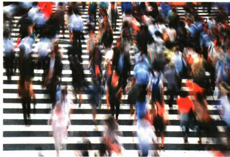
Η σταδιακή μείωση του εργατικού δυναμικού σιμοτά μειώνει αναπνοή, την οποία επιδεινώνει το γεγονός της οριακής και μόνο αύξησης της παραγωγικότητας του υπάρχοντος.

Οι δύο αυτές τάσεις, που αρχικά αποτελούσαν γνώρισμα της βιομηχανικής Δύσης, εξαπλώνονται, άνωσα αλλά σταθερά, και σε όλο τον υπόλοιπο κόσμο. Στις πλούσιες χώρες το προσδόκιμο επιβίωσης έχει αυξηθεί κατά περίπου δέκα χρόνια και συνήθως πλέον ξεπερνά τα 80 έτη. Αλλά και σε χώρες μικρότερου εισοδήματος έχει διπλασιασθεί σε σχέση με το 1950, φθάνοντας τα 63 έτη, με κύριο οδηγό τη μείωση της βρεφικής θνησιμότητας. Το 1972 το 14% των νεογέννητων σε Ινδία και Αφρική δεν επι-