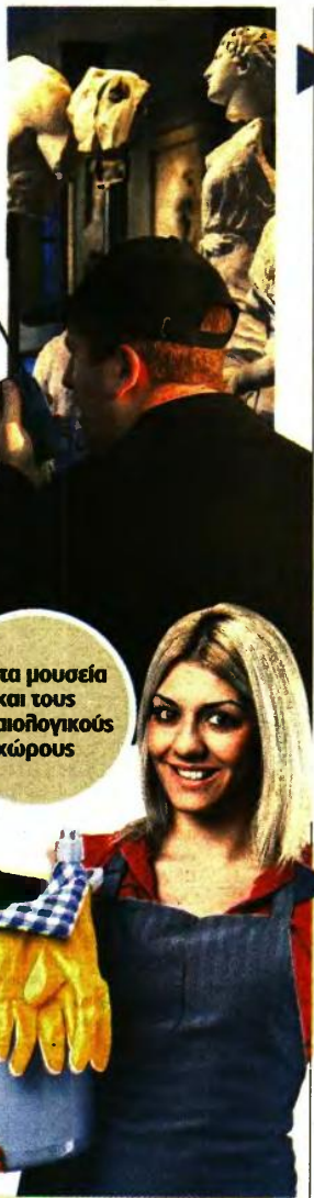
Για τα μουσεία και τους αρχαιολογικούς χώρους

Ημαθίας, Ηρακλείου, Θάσου, Θεσπρωτίας, Ικαρίας, Ιθάκης, Ιωαννίνων, Καβάλας, Καρδίτσας, Καστοριάς, Κέρκυρας, Κεφαλληνίας, Κιλίκης, Κοζάνης, Κορινθίας, Λήμνου, Κέας - Κύθνου, Τήνου, Σύρου, Θήρας, Νάξου, Ανδρου, Μυκόνου, Μήλου, Καλύμνου, Λακωνίας, Λάρισας, Λασιθίου, Λέβου, Μαγνησίας, Μεσσηνίας, Ξάνθης, Πειραιώς, Νήσων, Πελλάνας, Θεσσαλονίκης, Πιερίας, Πρέβεζας, Ρεθύμνης, Ροδόπης, Σάμου, Σερρών, Τρικάλων, Φθιώτιδας, Φλώρινας, Φωκίδας, Χαλκιδικής, Χανίων και Χίου. Όσοι προσληφθούν θα εργαστούν από την ημερομηνία υπογραφής της σύμβασης για διάρκεια απασχόλησης επτά (7) μηνών και όχι πέραν της 31.12.2023. ■