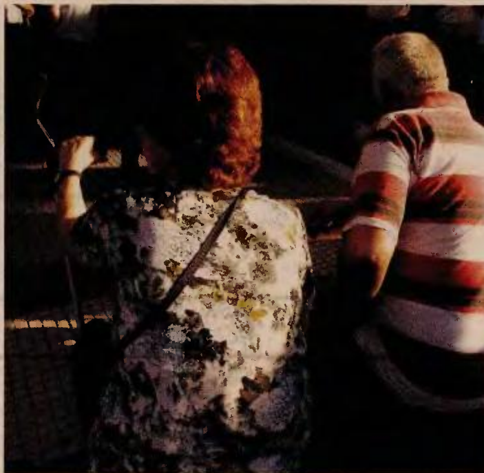
Ο δείκτης γήρανσης του πληθυσμού από 35,1% το 2022 θα αυξηθεί σε 59,9% το 2070. Σύμφωνα με τις προβλέψεις της Eurostat ο πληθυσμός της χώρας μας θα μειωθεί σε 8,6 εκατομμύρια το 2070.