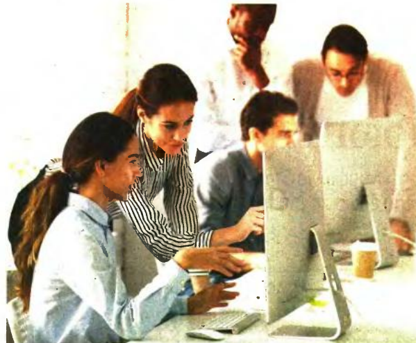
Ένα μέτρο που θα πρέπει σοβαρά να εξεταστεί είναι η ανάπτυξη του δεύτερου πυλώνα της ασφάλισης μέσα από τη σύσταση και λειτουργία των επαγγελματικών ταμείων.

ΣΗΜΕΡΑ , παρά τη μεγάλη μείωση των συντάξεων, ο ΕΦΚΑ θα πρέπει να χρηματοδοτείται από τον κρατικό προϋπολογισμό με ένα ποσό σε ετήσια βάση που ανέρχεται στα 15,8 δισ. ευρώ. Με δεδομένο ότι για τις κύριες μόνο συντάξεις η ετήσια δαπάνη ανέρχεται στα 27,5 δισ. ευρώ, αυτό σημαίνει ότι το Δημόσιο συμμετέχει