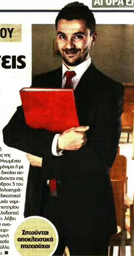
Ζητούνται αποκλειστικά πτυχιούχοι

δεκτοί όσοι: Ι . Έχουν άδεια άσκησης του δικηγορικού επαγγέλματος από δικηγορικό σύλλογο της χώρας ή από αρμόδια Αρχή κράτους-μέλους της Ευρωπαϊκής Ένωσης και του Ηνωμένου Βασιλείου ή είναι υπάλληλοι μόνιμοι ή με σύμβαση εργασίας ιδιωτικού δικαίου οριστού χρόνου, που περιλαμβάνονται στις κατηγορίες της παρ. 1 του άρθρου 3 του ν. 4440/2016 (Α' 224), συμβολαιογράφοι, δικαστικοί επιμελητές ή δικαστικοί υπάλληλοι και κατέχουν πτυχίο νομικής σχολής ημεδαπού πανεπιστημίου ή πτυχίο νομικής σχολής αλλοδαπού πανεπιστημίου, εφόσον έχει λάβει ακαδημαϊκή ή επαγγελματική αναγνώριση. ΙΙ . Έχουν γνώση χειρισμού ηλεκτρονικού υπολογιστή στα αντικείμενα: (Α) επεξεργασία κειμένων, (Β) υπολογιστικά φύλλα και (Γ) υπηρεσίες Διαδικτύου. ■