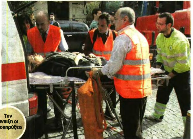
Την άνοιξη οι προκηρύξεις

Δύο νέα μεγάλα πακέτα προκηρύξεων αναμένεται να ανακοινωθούν το αμέσως επόμενο διάστημα. Πρόκειται για 910 θέσεις λοιπού επικουρικού προσωπικού στα νοσοκομεία και το ΕΚΑΒ όλης της χώρας και 872 θέσεις σε φορείς του υπουργείου Υποδομών και Μεταφορών. ■