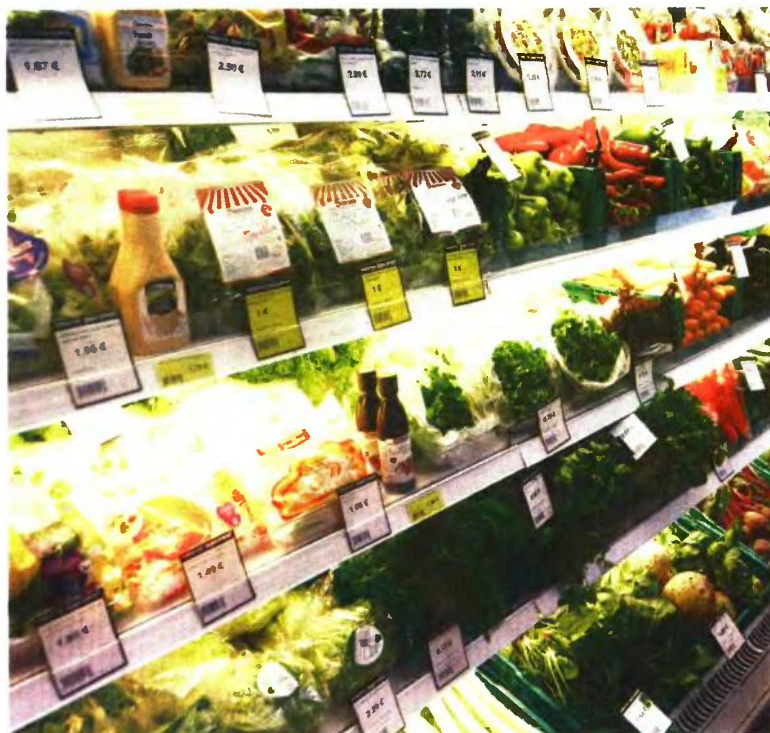
Όσοι κάνουν αιτήσεις για market pass 1 με 15 Μαρτίου θα λάβουν τις πρώτες δόσεις μέχρι τις 20 Μαρτίου.

Περισσότερα χρήματα θα πάρουν όσοι επιλέξουν την πίστωση των χρημάτων και τη διαθέσιμη τους για τις αγορές τους μέσω ειδικής ψηφιακής κρετωστικής κάρτας που θα αναλάβουν να τους εκδώσουν οι τράπεζες. Οι δικαιούχοι αυτοί θα λάβουν ποσά που κυμαίνονται από 22 έως 100 ευρώ τον μήνα ή από 132 έως 600 ευρώ το εξάμηνο. Όμως, θα είναι υποχρεωμένοι να χρησιμοποιήσουν τα χρήματα που θα πιστωθούν στις κάρτες τους μόνο για αγορές προϊόντων και αγαθών από καταστήματα και υπαίθριους πωλητές που δραστηριοποιούνται στο λιανικό εμπόριο τροφίμων, ιδίως σε ναυτοπωλεία, σουπερ μάρκετ, κρεπωλεία, καταστήματα ζαχαροπλαστικής, γαλακτοκομικών προϊόντων, αρτοποιεία και διάφορα άλλα καταστήματα τροφίμων. Όσοι επιλέξουν απλά να λάβουν τα χρήματα με πίστωση σε τραπεζικό λογαριασμό θα εισπράξουν τα ποσά της ενίσχυσης μειωμένα κατά 20%, δηλαδή θα πάρουν ποσά που θα κυμαίνονται από 17,6 έως 80 ευρώ τον μήνα ή από 106 έως 480 ευρώ το εξάμηνο. Ωστόσο, αυτοί που θα ζητήσουν να εισπράξουν την ενίσχυση μέσω των τραπεζικών τους λογαριασμών θα λάβουν