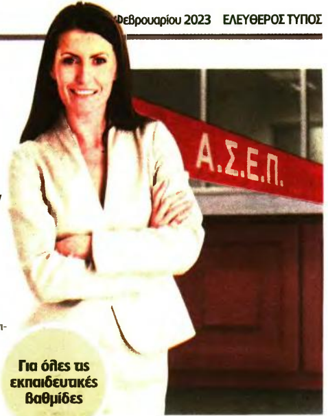
Για όλες τις εκπαιδευτικές βαθμίδες

Διαύγεια. Μέσω του νέου αυτού διαγωνισμού θα προσληφθούν 126 άτομα στο υπουργείο Προστασίας του Πολίτη και 61 άτομα στο υπουργείο Δικαιοσύνης. Οι θέσεις στα δύο υπουργεία θα καλυφθούν με μία κοινή προκήρυξη που επεξεργάζεται το ΑΣΕΠ. ■