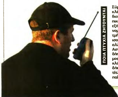
ΠΟΙΑ ΠΤΥΧΙΑ ΖΗΤΟΥΝΤΑΙ

δρόμο 100 μ. σε χρόνο δεκαεξί δευτερολέπτων (μία προσπάθεια), δρόμο 1.000 μ. σε χρόνο τεσσαράρων λεπτών και είκοσι δευτερολέπτων (μία προσπάθεια), άλμα σε ύψος με φόρα τουλάχιστον ενός μέτρου (1,00 μ.) (τρεις προσπάθειες), άλμα σε μήκος με φόρα τουλάχιστον τριών μέτρων και εξήντα εκατοστά (3,60 μ.) (τρεις προσπάθειες), ρίψη σφαίρας (7,275 χλγ.) σε απόσταση τουλάχιστον τεσσαρήνημι μέτρων (4,50 μ.).