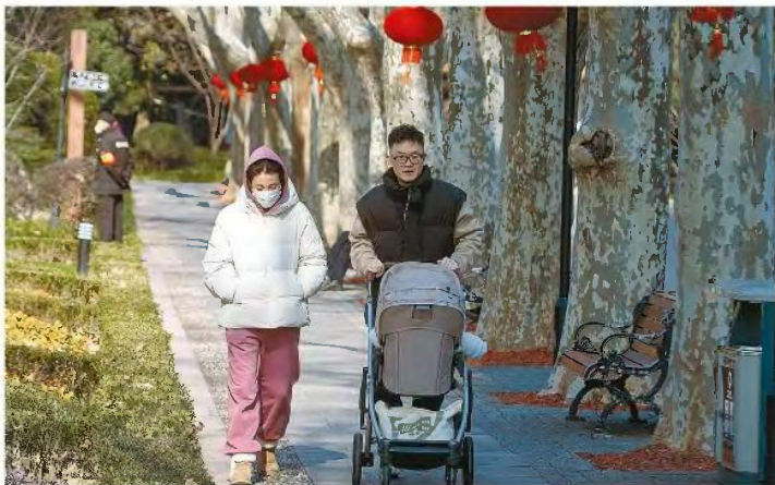
Το 2022 ο αριθμός των γεννήσεων ήταν μόλις 9,56 εκατ. παιδιά στην ηπειρωτική Κίνα, ενώ η κρατική στατιστική υπηρεσία κατέγραψε 10,41 εκατ. θανάτους την ίδια περίοδο, με τον κινεζικό πληθυσμό να μειώνεται έτσι κατά 850.000.

Πρόκειται για την πρώτη φορά μετά το 1961 που ο πληθυσμός της Κίνας μειώνεται. Το 1959 ο λιμός που προκλήθηκε από την επιπόλαια βιομηχανική πολιτική του «Μεγάλου άλματος προς τα εμπρός» οδήγησε δεκάδες εκατομμύρια Κινέζους στον θάνατο. Η παρούσα πληθυσμιακή συρρίκνωση σημειώνεται παρά τη χαλάρωση της πολιτικής περιορισμού της γεννητικότητας. Μέχρι και τις αρχές της δεκαετίας του 2010 οι Κινέζοι δεν είχαν δικαίωμα να αποκτήσουν πάνω από ένα παιδί. Μετά το 2021, όμως, οι οικογένειες μπορούν να αποκτήσουν τρία παιδιά. Η υποχώρηση των γεννήσεων αποδίδεται στη μετωπική αύξηση του κόστους ζωής, που περιλαμβάνει και τις εκπαιδευτικές δαπάνες. Την ίδια ώρα, η ε-