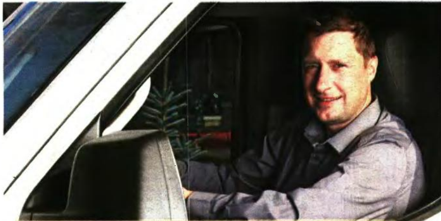
ΠΡΑΣΙΝΟ ΦΩΣ ΑΠΟ ΤΟ ΥΠ. ΕΣΩΤΕΡΙΚΩΝ