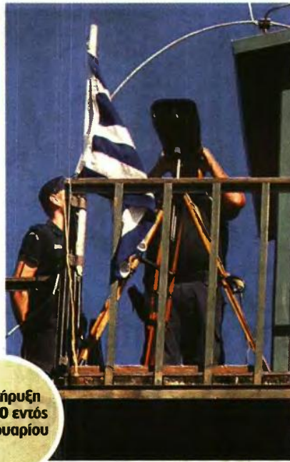
Προκήρυξη για 250 εντός Φεβρουαρίου

Οι συνοριακοί φύλακες ορισμένου χρόνου αποτελούν ξεχωριστή κατηγορία ένστολου προσωπικού της Ελληνικής Αστυνομίας, το οποίο προσλαμβάνεται με σχέση δημοσίου δικαίου με ετήσια θητεία, η οποία δύναται να ανανεώνεται ετησίως. ■