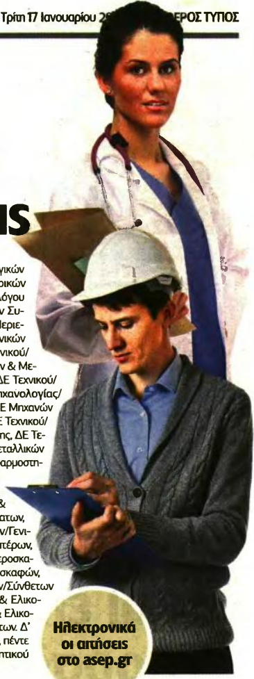
Ηλεκτρονικά οι αιτήσεις στο asef.gr

& Περιστεροφρέμων Πτερύγων, ΔΕ Ξυλουργικών Εργασιών, ΔΕ Ηλεκτρολογίας, ΔΕ Εσωτερικών Ηλεκτρικών Εγκαταστάσεων, ΔΕ Ηλεκτρολόγου Γενικών Εφαρμογών, ΔΕ Ηλεκτρολογικών Συστημάτων Αυτοκινήτων - Οχημάτων, ΔΕ Περιελίξεων Ηλεκτρικών Μηχανών, ΔΕ Ηλεκτρονικών Εγκαταστάσεων & Αυτοματισμού, ΔΕ Τεχνικού/ Ηλεκτρονικής/Συστημάτων Τηλεπικοινωνιών & Μετάδοσης Πληροφορίας, ΔΕ αμαξωμάτων, ΔΕ Τεχνικού/ Μηχανολογίας/Εργαλειομηχανών, ΔΕ Μηχανολογίας/ Θερμικών & Υδραυλικών Εγκαταστάσεων, ΔΕ Μηχανών & Συστημάτων Αυτοκινήτων - Οχημάτων, ΔΕ Τεχνικού/ Μηχανολογίας/Μηχανών Εσωτερικής Καύσης, ΔΕ Τεχνικού/ Μηχανολογίας/Συγκολλήσεων & Μεταλλικών Κατασκευών - Κατεργασιών, ΔΕ Τεχνικός Εφαρμοσμένου, ΔΕ Εγκαταστάσεων & Κλιματισμού, ΔΕ Χειριστών Χωματουργικών & Ανυψωτικών Μηχανημάτων/Χειριστή Εξοκαπτικών & Χωματουργικών & Ανυψωτικών Μηχανημάτων, ΔΕ Τεχνικών Αεροσκαφών & Ελικοπτέρων/Τεχνικών Εφαρμοσμένων Αεροσκαφών & Ελικοπτέρων, ΔΕ Κινητήρων Αεροσκαφών, ΔΕ Τεχνικών Αεροσκαφών & Ελικοπτέρων/Μηχανουργών Αεροσκαφών, ΔΕ Τεχνικών Αεροσκαφών & Ελικοπτέρων/Σύνθετων Αεροσκαφών, ΔΕ Τεχνικών Αεροσκαφών & Ελικοπτέρων/Τεχνικών Χρώσεως Αεροσκαφών & Ελικοπτέρων, ΔΕ Χειριστών Ιατρικών Μηχανημάτων. Δ' Κατηγορία Υποχρεωτικής Εκπαίδευσης (ΥΕ), πέντε (5) θέσεις, Κλάδου/Ειδικότητας: ΥΕ Βοηθητικού Υγειονομικού Προσωπικού. ■