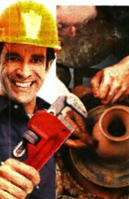
ΣΥΝΗΡΤΗΣ ΣΤΑ ΙΩΑΝΝΙΝΑ