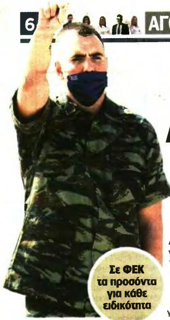
Σε ΦΕΚ τα προσόντα για κάθε ειδικότητα

Τρίτη 17 Ιανουαρίου 2023 ΕΛΕΥΘΕΡΟΣ ΤΥΠΟΣ