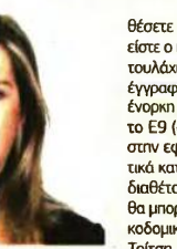
τοπογράφος - Διευκρινιστής

7 Πώς γίνεται η δήλωση με αίτια κτήσεως κληρονομιάς; Σε αυτή τη περίπτωση θα δευτερεύοντα νομικά και ακίνητο δεν μπορεί να δηλωθεί στο Κτηματολόγιο. Επομένως θα