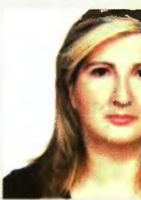
Γράφει η αγρονόμος - μηχανικός Γραμματέας

5 Δεν πρόλαβα να κάνω την αποδοχή κληρονομιάς. Μπορώ να δηλώσω το ακίνητο; Όσοι ιδιοκτήτες έχουν αποκτήσει με κληρονομιά ακίνητα για τα οποία δεν έχουν συντάξει και μεταγράψει πράξη αποδοχής κληρονομιάς οι ίδιοι ή οι γονείς τους μπορούν να υποβάλουν τη δήλωση στο Κτηματολόγιο συνοψίζοντας τα έγγραφα με τα οποία στοιχειοθετείται το κληρονομικό τους δικαίωμα, ακόμη και πριν από τη σύνταξη της πράξης αποδοχής κληρονομιάς.