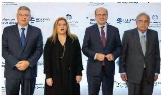
(Από αριστερά) ο διευθύνων σύμβουλος της HELLENIQ ENERGY Ανδρέας Σιάμισης, η υφυπουργός για τη Δημογραφική Πολιτική και την Οικογένεια Μαρία Συρεγγέλα, ο υπουργός Εργασίας και Κοινωνικών Υποθέσεων Κωστή Χατζηδάκης και ο πρόεδρος του Διοικητικού Συμβουλίου της HELLENIQ ENERGY Γιάννης Παπαθανασίου.

Δικαίωμα συμμετοχής στο πρόγραμμα προσφοράς δωρεάν πετρελαίου θέρμανσης έχουν οικογένειες με 4 παιδιά και άνω που διαμένουν μόνιμα στην Ελλάδα και χρησιμοποιούν πετρέλαιο θέρμανσης στη φορολογική τους κατοικία. Επιπλέον, θα πρέπει να εντάσσονται στα εισοδηματικά κριτήρια που έχουν θεσπιστεί – σύμφωνα με την Έρευνα Εισοδήματος και Συνθηκών Διαβίωσης των Νοικοκυριών για το έτος 2021 της Ελληνικής Στατιστικής Αρχής – τα οποία, ωστόσο, έχουν προσαυξηθεί κατά 10,5% από τη HELLENIQ ENERGY, με στόχο να συμπεριληφθούν ακόμα περισσότερες οικογένειες. Συγκεκριμένα, για μία οικογένεια με 4 παιδιά το ετήσιο οικογενειακό εισόδημα δεν πρέπει να ξεπερνάει τις 20.500€, ενώ αυξάνεται κατά 2.626€ για κάθε επιπλέον τέκνο πέραν των τεσσάρων. Για την υλοποίηση της νέας αυτής πρωτοβουλίας, από την οποία αναμένεται να επωφεληθούν χιλιάδες οικογένειες σε όλη την Ελλάδα, η HELLENIQ ENERGY δημιούργησε τη διαδικτυακή πλατφόρμα www.zestasia.helleniq.gr , μέσω της