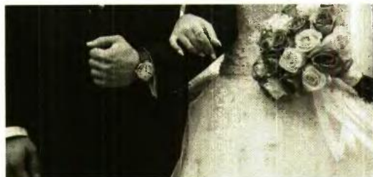
Στα 960 ήδη τα ζευγάρια που ενώθηκαν... «εις σάρκα μία»

Ο ς χρονιά των γάμων μπορεί να χαρακτηριστεί το 2022 που ολοκληρώνεται σε λίγες ημέρες. Ο αριθμός των γάμων που τελέστηκαν έως και τέλη Νοεμβρίου, αγγίζει τα επίπεδα προ πανδημίας, ενώ σημαντικός είναι και ο αριθμός των συμφώνων συμβίωσης που έχουν συναφθεί ως εναλλακτικός τρόπος για την επισημοποίηση της κοινής πορείας ενός ζευγαριού.