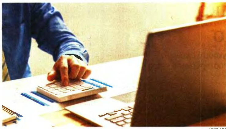
Η αυτόματη συμπλήρωση δεν θα καταργήσει γενικά την ανάγκη υποβολής δηλώσεων Ε9.

Η ΑΑΔΕ αναμένεται σύντομα να θέσει σε λειτουργία μια νέα αυτόματη ηλεκτρονική διαδικασία με την οποία κάθε φορά που θα γίνεται κάποια μεταβίβαση ακινήτου (αγοραπωλησία, δωρεά, γονική παροχή ή κληρονομιά) το ηλεκτρονικό αρχείο των δηλώσεων Ε9 (το ηλεκτρονικό περιουσιολόγιο της εφορίας) θα ενημερώνεται αυτόματα και δεν θα χρειάζεται πλέον οι φορολογούμενοι να υποβάλουν τροποποιητικές δηλώσεις Ε9. Δηλαδή, με τη νέα αυτή ψηφιακή υπηρεσία, οι δηλώσεις Ε9 των φορολογουμένων που είναι συμβαλλόμενοι σε κάθε μεταβίβαση, δωρεά ή γονική παροχή ακινήτου θα συμπληρώνονται αυτόματα με άνιληση των στοιχείων από την ηλεκτρονική πλατφόρμα myProperty της ΑΑΔΕ, στην οποία θα έχουν υποβληθεί οι σχετικές