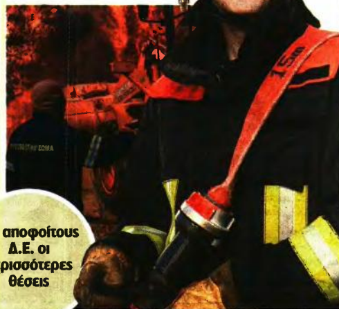
Για αποφοίτους Δ.Ε. οι περισσότερες θέσεις

Οπως έχει προαναγγείλει και ο υπουργός Εσωτερικών, Μάκης Βορίδης, κατά την παρουσίαση του προγραμματισμού προσλήψεων για το 2023, η γλιοντότητα των θέσεων θα απευθύνεται σε αποφοίτους Δευτεροβάθμιας Εκπαίδευσης. Συγκεκριμένα, ο υπουργός είχε δηλώσει πως «οι περισσότερες θέσεις Δ.Ε. θα προορίζονται για τις παραγωγικές σχολές (στρατιωτικές, αστυνομικές, Πυροσβεστικής, Λιμενικού), οι σπουδαστές των οποίων με την αποφοίτησή τους θα ενταχθούν στην κατηγορία Π.Ε.».