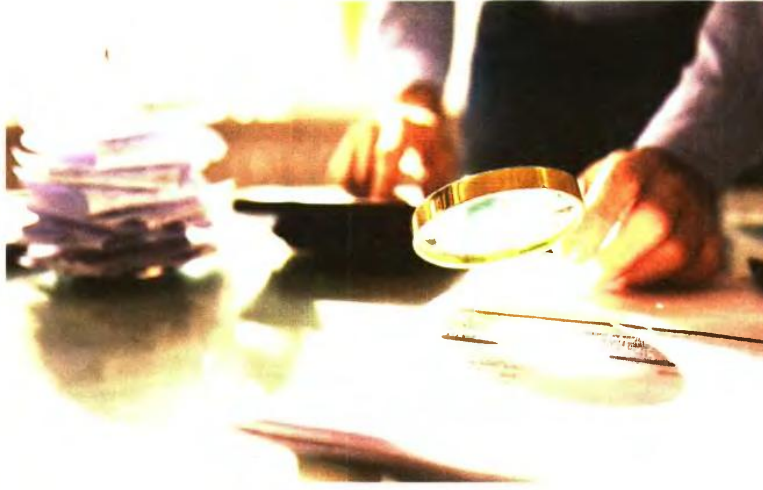
Σε περίπτωση διαπίστωσης, στο πλαίσιο ελέγχου, εκ νέου διάπραξης της ίδιας παράβασης, εντός πενταετίας από την έκδοση της αρχικής πράξης, επιβάλλονται διπλάσια πρόστιμα.

στ) Προσαρμόζει την ονομασία των εμπλεκόμενων οργάνων της Φορολογικής Διοίκησης στην οργανωτική μεταβολή που επέφερε η σύσταση της Ανεξάρτητης Αρχής Δημο-