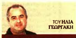
ΤΟΥ ΗΛΙΑ ΓΕΩΡΓΑΚΗ

Το υπουργείο Εργασίας και η ΔΥΠΙΑ δίνουν διευκρινίσεις για τη χρηματοδότηση, την κοινωνική αντιπαροχή και τη σύμπραξη δημόσιου και ιδιωτικού τομέα με στόχο την ανέγερση κατοικιών