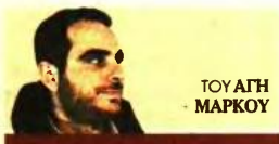
ΤΟΥ ΑΓΓΗ ΜΑΡΚΟΥ

Σ ε κλειδί επιβαρύνσεων βρίσκονται χιλιάδες νοικοκυριά με στεγαστικό δάνειο, καθώς η άνοδος των επιτοκίων από την ΕΚΤ που ξεκίνησε τον περασμένο Ιούλιο για τον έλεγχο του πληθωρισμού θα συνεχιστεί κατά τα φαινόμενα τουλάχιστον έως και τις αρχές του 2023. Στη συνεδρίαση του Οκτωβρίου το βασικό επιτόκιο του ευρώ αναπροσαρμόστηκε κατά 75 μονάδες βάσης στο 2%, με την επικεφαλής της Ευρωτράπεζας Κριστίν Λαγκάρντ να προεξοφλεί