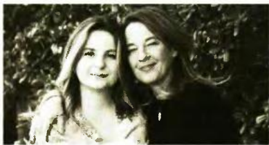
Μαμά και κόρη χαρούμενες που βγήκαν ακόμη πιο δυνατές από μια δύσκολη δοκιμασία