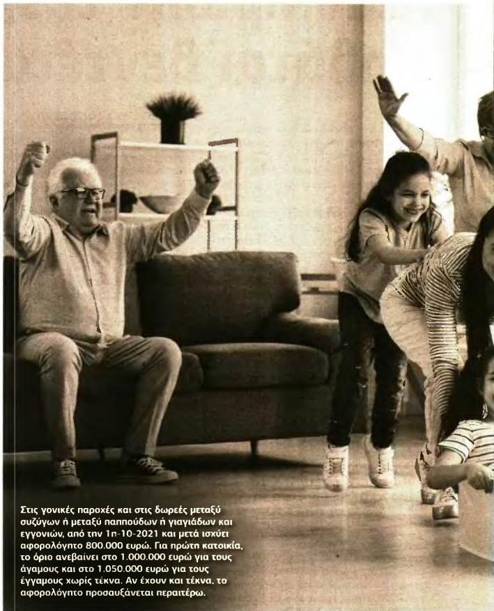
Στις γονικές παροχές και στις δωρεές μεταξύ συγγενών ή μεταξύ παππούδων ή γιαγιάδων και εγγονιών, από την 1η-10-2021 και μετά ισχύει αφορολόγητο 800.000 ευρώ. Για πρώτη κατοικία, το όριο ανεβαίνει στο 1.000.000 ευρώ για τους άγαμους και στο 1.050.000 ευρώ για τους έγγαμους χωρίς τέκνα. Αν έχουν και τέκνα, το αφορολόγητο προσαυξάνεται περαιτέρω.