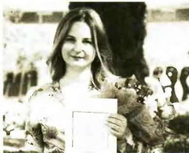
Με το πολυπόθητο πτυχίο στο χέρι

Και όπως παρατηρεί μέσα και από τη δική της εμπειρία, είναι πλέον όχι απλά πολύ δύσκολο αλλά για κάποιες οικογένειες ακατόρθωτο να σπουδάζουν παιδιά. «Όσοι το κάνουν είναι ήρωες. Και αυτό λέω και στους φοιτητές στη σχολή που εργάζομαι. Να επικεντρωθούν στα μαθήματά τους, να πετύχουν τον στόχο τους γιατί από πίσω υπάρχουν γονείς, ολόκληρες οικογένειες που στερούνται και το ψωμί, τη θέρμανση, το ρεύμα για να μπορέσουν να σπουδάσουν. Προσωπικά νιώθω υπερήφανη για την οικογένειά μου», λέει συγκινημένη η μητέρα.