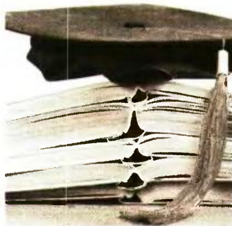
Τρεις φοιτητές του Πανεπιστημίου Θεσσαλίας θα λάβουν υποτροφίες 1.000 ευρώ

Σύμφωνα με τον πρόεδρο της Ισραηλιτικής Κοινότητας Βόλου, Μαρσέλ Σολομών, ο θεσμός της απονομής υποτροφιών σε φοιτητές του Πανεπιστημίου Θεσσαλίας ξεκίνησε από το 2009 και έκτοτε έχουν σπληνχθεί οικονομικά συνολικά 42 φοιτητές . «Το 2009 ήταν η πρώτη φορά που αποφασίσαμε να δώσουμε υποτροφίες σε τρεις φοιτητές ως Ισραηλιτική Κοινότητα Βόλου. Το Πανεπι-