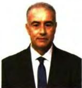
> ΤΟΥ ΝΙΚΟΥ ΡΟΓΚΑΚΟΥ

Τ ρεις θα είναι οι κατηγορίες δικαιούχων επιδόματος θέρμανσης, και το νέο στοιχείο είναι ότι όσοι υποβάλλουν για πρώτη φορά αίτηση, θα εξεταστούν με τα περσινά και όχι τα φετινά εισοδηματικά κριτήρια. Εξαρχής στόχος του υπουργείου Οικονομικών ήταν -και παραμένει- να ενθαρρύνει όσους έκαψαν πέρσι φυσικό αέριο και, πολύ περισσότερο, ρεύμα, να κάψουν φέτος πετρέλαιο για τη θέρμανσή τους. Ο διπλασιασμός του αυξημένου επιδόματος χαρακτηρίζεται ως ισχυρό κίνητρο από το οικονομικό επιτελείο, ωστόσο στην πορεία διαπιστώθηκε ότι έπρεπε να μπουκ και ασφαλιστικές δικλίδες.