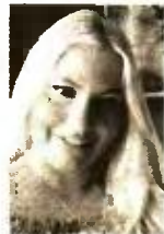
Γράφει η Τζίνα Αθελιάκη Δικηγόρος Αθηνών

Α ρχικά, ως αμβλωση ορίζουμε τη διακοπή μιας αδιατάρακτης ενδομήτρου κύησης ενός ή περισσότερων εμβρύων, που γίνεται σε πρώιμη ηλικία κύησης (λιγότερες από 24 εβδομάδες) με χημικές ή χειρουργικές μεθόδους και οδηγεί σε αφαίρεση του εμβρύου από τη μήτρα και κατ' επέκταση στον θάνατό του. Το όριο των 24 εβδομάδων καθορίστηκε με βάση την ελάχιστη ηλικία κύησης που επιτρέπει σε ένα έμβρυο να είναι βιώσιμο. Σε περίπτωση χειρουργικής διακοπής κύησης θα πρέπει να τηρούνται τα σύμφωνα με τον Ν. 1609/86 ΦΕΚ Α/86,304 Πκ).