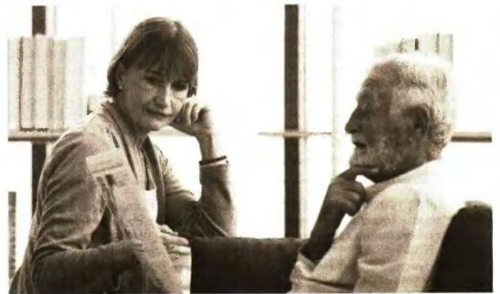
Τι ισχύει και τι αλλάζει στα όρια ηλικίας για πρόωγη σύνταξη από το Δημόσιο

Οι αλλαγές αφορούν στους παλαιούς ασφαλισμένους που έχουν «ένοσημο» πριν το 1993. Οι νέοι από 1993 και μετά έχουν ως όριο το 62ο έτος με 40 έτη ασφάλισης για πλήρη σύνταξη, ενώ με λιγότερα χρόνια βγαίνουν είτε στα 67 για πλήρη είτε στα 62 για μειωμένη σύνταξη. Με τις ρυθμίσεις που γίνονται στα όρια ηλικίας για μειωμένη σύνταξη οι προϋποθέσεις συνταξιοδότησης των παλαιών ασφαλισμένων εξομοιώνονται από το 2023 με αυτές των νέων. ■