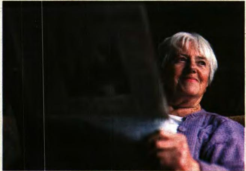
ΟΙ ΣΥΝΤΑΞΙΟΥΧΟΙ ΜΕ 3 ΑΥΞΗΣΕΙΣ ΤΟ 2023 ΚΑΙ ΤΑ ΠΟΣΑ(*)

Για δε τους 850.000 συνταξιούχους που εμπήκουν στην προσωπική διαφορά του νόμου Κατρούγκαλου είπε ότι οι 504.000 θα ωφεληθούν άμεσα λόγω της κατάργησης της εισφοράς αλληλεγγύης.