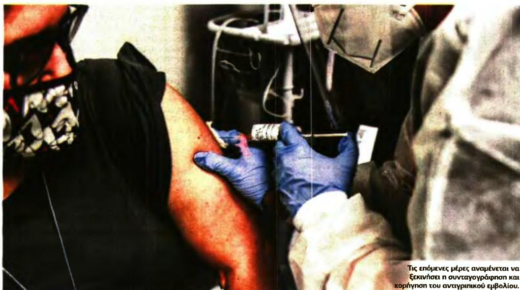
Τις επόμενες μέρες αναμένεται να ξεκινήσει η συνταγογράφηση και χορήγηση του αναγριπικού εμβολίου.

ΕΠΙΣΤΗΜΟΝΙΚΗ ΣΥΣΤΑΣΗ ΓΙΑ ΕΜΒΟΛΙΑΣΜΟ ΣΤΙΣ ΕΥΠΑΘΕΙΣ ΟΜΑΔΕΣ