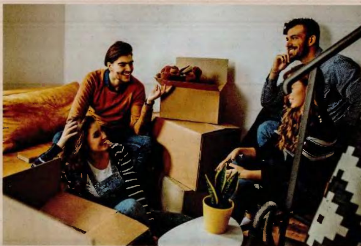
Πολλά νέα ζευγάρια ξεκινούν με την πρόθεση να αγοράσουν ένα ακίνητο και τελικά καταλήγουν να νοικιάσουν. Οι χαμηλοί μισθοί, το υψηλό κόστος των κατοικιών, μετά τις συνεχείς αυξήσεις των τελευταίων ετών, αλλά και η δυσκολία πρόσβασης σε τραπεζική χρηματοδότηση καθιστούν πολύ δύσκολη την αγορά κατοικίας.

λευταία διαθέσιμα στοιχεία της Ελληνικής Στατιστικής Αρχής (ΕΛΣΤΑΤ), 497,11 ευρώ και για τους νέους 25-34 ετών 760,55 ευρώ, η εξίσωση απλώς δεν... βγαίνει. Ακόμη και εάν δεν πληρώνει ενοίκιο, το γεγονός ότι θα πρέπει πλέον να δαπανήσει, εάν θέλει να αγοράσει τα ίδια τρόφιμα, το 34% του μηνιαίου εισοδήματός του αντί για το 29% πέρυσι, αμέσως σημαίνει σημαντική μείωση του εισοδήματός του. Εάν μέχρι