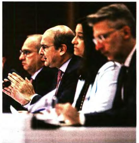
Το πρόγραμμα «Σπίτι μου» παρουσίασαν χθες οι συναρμόδιοι υπουργοί Εργασίας, Κ. Χατζηδάκης, Παιδείας, Ν. Κεραμιώης, Ενέργειας, Κ. Σκρέκας, και ο διοικητής της ΔΥΠΑ-ΟΑΕΔ, Σπύρος Πρωτοπαύλης, παρουσία του υφυπουργού παρά τω πρωθυπουργώ, Αλπ. Σκέρτσου, και του κυβερνητικού εκπροσώπου, Γιάννη Οικονόμου.

Το μέτρο μπορεί να επεκταθεί και σε άλλα διαθέσιμα ακίνητα του υπουργείου Εργασίας κατόπιν αξιολόγησης της κατάστασης του κάθε ακινήτου. ■