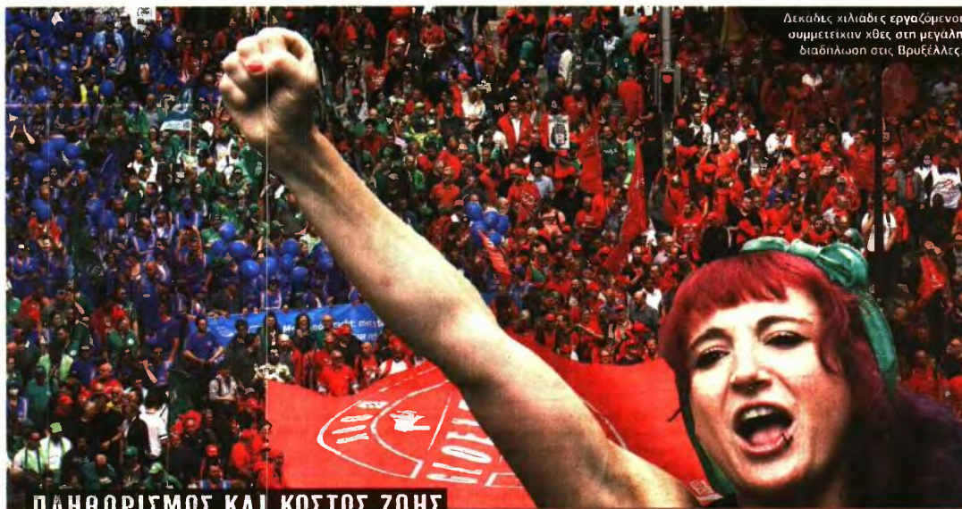
Δεκάδες χιλιάδες εργαζόμενοι συμμετείχαν χτες στη μεγάλη διαδήλωση στις Βρυξέλλες.

Εκτοξεύτηκε το κόστος διαβίωσης των πολιτών σε όλο τον κόσμο