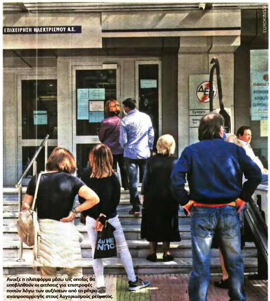
Ανοίξε η πλατφόρμα μέσω της οποίας θα υποβληθούν οι αιτήσεις για επιστροφές ποσών λόγω των αυξήσεων από τη ρύθμιση αναπροσαρμογής στους λογαριασμούς ρεύματος.

▶ Αν ο δικαιούχος έχει αλλάξει κύρια κατοικία, κατά το διάστημα 1η-12-2021 έως 1η-5-2022, συμπληρώνει τα αντίστοιχα πλήρη στοιχεία για την