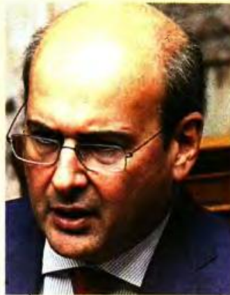
Ο υπουργός Εργασίας Κωστής Χατζηδάκης ξεκαθαρίζει ότι από 1.1.2023 η αύξηση θα αφορά τουλάχιστον 1,5 εκατ. συνταξιούχους και θα υπολογισθεί στο καταβαλλόμενο ποσό της σύνταξης

«Τα νέα μέτρα στήριξης το 2023 που θα αφορούν τους συνταξιού-