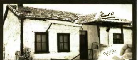
Μέσα στο φθινόπωρο θα προκηρυχθεί και νεος κύκλος Εξοικονομώ για κατοικίες

Αν πάντως, έτσι ο συνολικός (φετινός) προϋπολογισμός των Εξοικονομώ φτάνει τα 1,6 δισ. ευρώ, η αντίστοιχη συνολική μόχλευση πόρων σε βάθος 5ετίας για τη χρηματοδότηση των προγραμμάτων ενεργειακής αναβάθμισης κτιρίων επιχειρήσεων, δημοσίων κτιρίων και νοικοκυριών, θα ξεπεράσει τα 4 δισ. ευρώ. Ένα ποσό εντυπωσιακό, αλλά το κυριότερο στοιχείο παραμένει το ότι «έρχεται» να ενισχύσει τους δυναμικά ωφελούμενους εν μέσω της χειρότερης ενεργειακής κρίσης της τελευταίας 50ετίας.