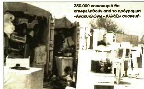
350.000 νοικοκυριά θα επωφεληθούν από το πρόγραμμα «Ανακυκλώνω - Αλλάζω συσκευή»

Αναμένεται να ωφεληθούν περίπου 350.000 νοικοκυριά, που θα καταφέρουν να μειώσουν μεσοσταθμικά 30% την κατανάλωση και στον λογαριασμό του ρεύματος. Από την εξοικονόμηση αυτή, εκτιμάται ότι οι πολίτες θα δουν μείωση στους λογαριασμούς ρεύματος των νοικοκυριών τους από 150 έως 300 ευρώ τον χρόνο. Στην ηλεκτρονική πλατφόρμα -που θα ανοίξει αρχές Ιουνίου- θα μπορούν όλοι όσοι θέλουν να κάνουν αίτηση χωρίς κατ' αρχήν «κόφτη». Εφόσον υποβληθούν πάνω από 350.000 αιτήσεις θα γίνει ιεράρχηση των αιτήσεων με σειρά κριτηρίων κατάταξης: Εισοδήματα, κοινωνικά κριτήρια (π.χ. ΑμεΑ,