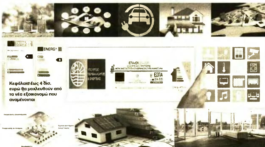
Κεφάλαια έως 4 δισ. ευρώ θα μοχλευθούν από τα νέα εξοικονομώ που αναμένονται

Τα Εξοικονομώ, πέρα από το σαφές περιβαλλοντικό αποτύπωμα, έχουν και τη διάσταση μιας πρωτοβουλίας αναχαίτισης της ακρίβειας