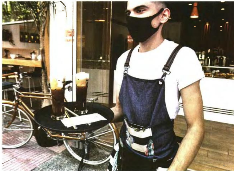
Η νέα Εθνική Γενική Συλλογική Σύμβαση Εργασίας θα υπογραφεί έως τέλη Ιουνίου.

Σύμφωνα με ασφαλείς πληροφορίες του «Κ», οι προτάσεις αυτές θα τεθούν στην αιχμή της διαπραγμάτευσης που ξεκινάει προ λίγων ημερών μεταξύ των κοινωνικών εταίρων (ΣΕΒ, ΓΣΕΕ, ΓΣΕΒΕΕ κ.λπ.) σε σχέση με την ανανέωση της Εθνικής Γενικής Συλλογικής Σύμβασης Εργασίας (ΕΓΣΣΕ). Η υπογραφή της νέας ΕΓΣΣΕ αναμένεται έως τα τέλη του Ιουνίου. Εφόσον υπάρξει συμφωνία μεταξύ των κοινωνικών εταίρων, θα μπορούσαν να αποσπαστεί μέρος της νέας ΕΓΣΣΕ, αναφέροντας οι ίδιες πηγές, αποτελώντας έτσι μια βιολύμπια σημασία πρόταση προς την κυβέρνηση, στην κατεύθυνση της αλλαγής του υφιστάμενου θεσμικού πλαισίου για τον κατώτατο μισθό και τις συλλογικές διαπραγματεύσεις προς τα τέλη του τρέχοντος έτους ή τις αρχές του επόμενου.