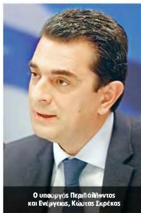
Ο υπουργός Περιβάλλοντος και Ενέργειας, Κώστας Τσιάκρας

ρίων που στεγάζουν υπηρεσίες του ευρύτερου δημόσιου τομέα και καταλαμβάνουν έκταση περί τα 2,5 εκατ. τ.μ. Για τα κτίρια του Δημοσίου προβλέπεται η επίσημη ενεργειακή αναβάθμιση του 3% του συνολικού εμβαδού των κτιρίων της κεντρικής διοίκησης, ενώ θα υπάρχει η δυνατότητα συμμετοχής και των εταιρειών ενεργειακών υπηρεσιών. Ηδη έχει υπογραφεί συμφωνία με την Ευρωπαϊκή Τράπεζα Επενδύσεων, ύψους 375 εκατ. ευρώ, για τη στήριξη του προγράμματος «Ηλέκτρα», που θα συμβάλει στη βελτίωση της ενεργειακής απόδοσης σε δημόσια κτίρια. Το συνολικό ύψος του προγράμματος ανέρχεται σε 640 εκατ. ευρώ. Το πρόγραμμα αφορά κτίρια του Δημοσίου που εντάσσονται στο Μητρώο Φορέων της Γενικής Κυβέρνησης (το οποίο καταρτίζεται από τη Στατιστική Υπηρεσία) και έχουν μεγάλη επίσημη κατανάλωση πρωτογενούς ενέργειας. Ανάμεσα σε αυτά περιλαμβάνονται: