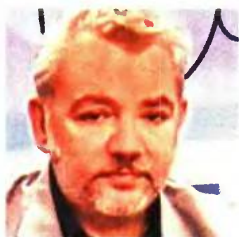
Του Γιάννη Χαντζησαλάτα *

Ποια νοικοκυριά και ποιες επιχειρήσεις θα έχουν όφελος από τις εξαγγελίες της κυβέρνησης