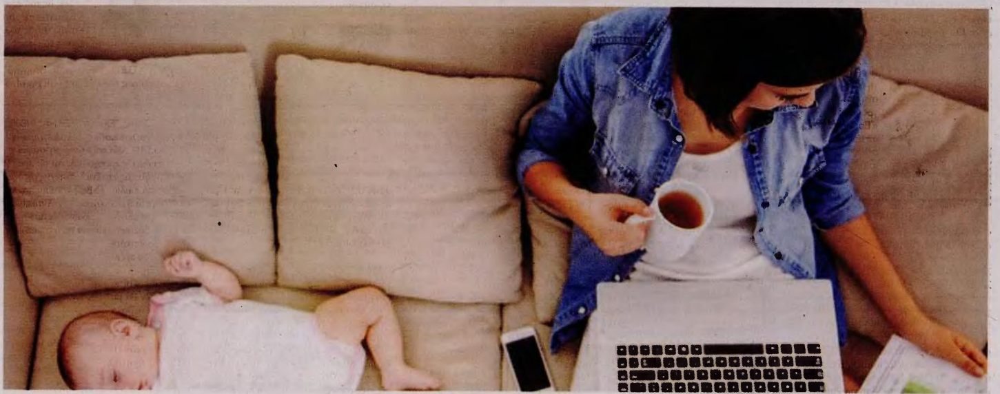
Ή κ. Θεοχαρίδου-Ινεπολάγλου γράφει γιά τήν χαρά τής οικογένειας στό συλλογικό έργο «Μια άγκαλιά γεμάτη παιδιά», πού κυκλοφορεί από τής εκδόσεις «Έαρ».