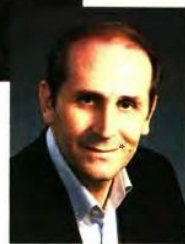
Ο υφυπουργός Οικονομικών, Απόστολος Βεαυρόπουλος

Δόσεις Παράλληλα, η προτεινόμενη διαδικασία εξαγοράς αποκλείει κάθε ενδεχόμενο απονομής τίτλων σε κατόχους που δεν μπορούν να αποδείξουν τις προϋποθέσεις του νόμου. Στην ψηφιακή εποχή, άλλωστε, τόσο η τήρηση των όρων καταβολής δόσεων για την απόκτηση του καταπατημένου ακινήτου όσο και η υποβολή δικαιολογητικών από τους κατά τόπους ενδιαφερομένους θα γίνονται αποκλειστικά με τη χρήση ειδικής ψηφιακής πλατφόρμας, κλείνοντας κερκόπορτες και παραθυράκια.