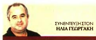
ΣΥΝΕΝΤΕΥΞΗ ΣΤΟΝ ΗΛΙΑ ΓΕΩΡΓΙΑΚΗ

Ο υφυπουργός Εργασίας και Κοινωνικών Υποθέσεων μιλάει στα «NEA» και αναγγέλλει και την αύξηση όλων των συντάξεων από 1ης Ιανουαρίου 2023