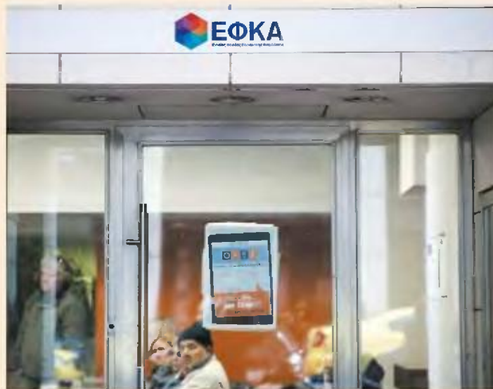
Εως και 150 ημέρες ασφάλισης επιπλέον μπορούν να αναγνωρίσουν όσοι έχουν συμπληρώσει τα 67 έτη.

Επίσης, προβλέπεται ότι, σε περιπτώσεις που η σύνταξη συναρτάται με την αναπηρία του ασφαλισμένου, η έναρξη επεξεργασίας του αιτήματος θα γίνεται αφού προσκομισθεί βεβαίωση από το αρμόδιο ΚΕΠΑ σχετικά με το ποσοστό αναπηρίας του. Στην πράξη, το σχετικό άρθρο αφορά τη διαδικασία αυτοματοποιημένου ελέγχου, στο πλαίσιο της διαδικασίας έναρξης του δικαιώματος σύνταξης γήρατος. Και ορίζει ότι ο έλεγχος οφειλών προκειμένου να