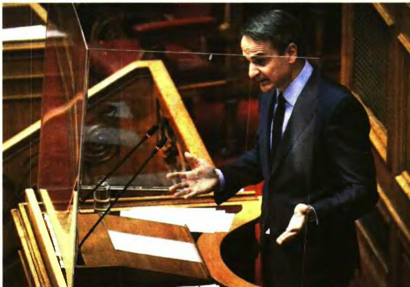
Αίσθηση προκάλεσε η ισχυρή συμμετοχή βουλευτών του ΣΥΡΙΖΑ και τα κενά έδρανα του ΚΙΝ.ΑΛ., κάτι άλλωστε που σχολίασε ο πρωθυπουργός λέγοντας: «Μου κάνει εντύπωση η περιορισμένη συμμετοχή στην αίθουσα της αντιπολίτευσης. Δεν βλέπω κανένα βουλευτή από το ΚΙΝ.ΑΛ., θα νόμιζε κανείς ότι έχει συνέδριο το ΚΙΝ.ΑΛ.».

Ξεκαθάρισε πως τα επιδόματα ανεργίας δεν είναι για να τα σπαταλάμε. «Πρέπει να έχουμε στοχευμένα