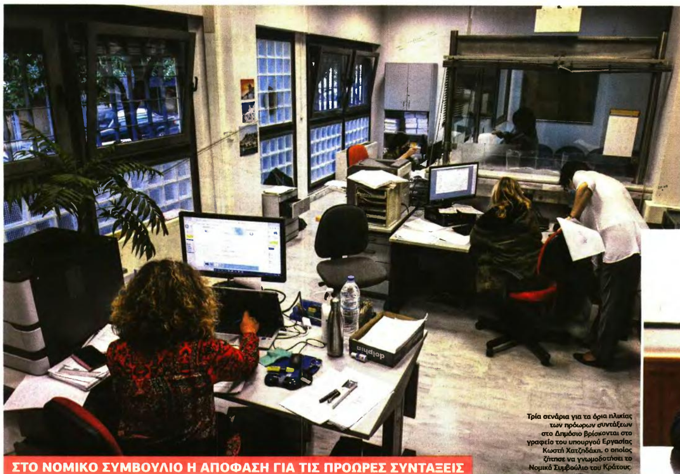
Τρία σενάρια για τα όρια ηλικίας των πρόωρων συντάξεων στο Δημόσιο βρίσκονται στο γραφείο του υπουργού Εργασίας Κωστή Κατσίγκη, ο οποίος ζήτησε να γνωμοδοτήσει το Νομικό Συμβούλιο του Κράτους.

ΣΤΟ ΝΟΜΙΚΟ ΣΥΜΒΟΥΛΙΟ Η ΑΠΟΦΑΣΗ ΓΙΑ ΤΙΣ ΠΡΩΩΡΕΣ ΣΥΝΤΑΞΕΙΣ