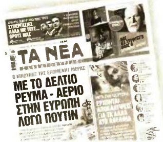
Το πρωτοσέλιδο των «ΝΕΩΝ» το Σάββατο 2 Απριλίου

ΤΟΝ ΚΩΔΩΝΑ ΤΟΥ ΚΙΝΔΥΝΟΥ για ενδεχόμενες διακοπές ρεύματος και ηλεκτρική ενέργεια με το δελτίο έκρουσε ο πρόεδρος της ΓΕΝΟΠ - ΔΕΗ, Γιώργος Αδαμίδης, ο οποίος εκτιμά ότι έρχονται ζοφερές ημέρες για τα ελληνικά νοικοκυριά στον τομέα της ηλεκτρικής ενέργειας. Μιλώντας στον τηλεοπτικό σταθμό OPEN, ο Γιώργος Αδαμίδης εμφανίστηκε σίγουρος ότι θα υπάρξουν διακοπές ρεύματος και όχι μόνο στις βιομηχανίες, όταν θα αυξηθεί η ζήτηση του ρεύματος, ενώ τόνισε ότι «αν έχουμε προβλήματα με τη ροή του φυσικού αερίου, θα έχουμε περίπου ρεύμα με δελτίο». Ο Γ. Αδαμίδης κατηγόρησε την κυβέρνηση για εμμονή επειδή κρατά πολύ χαμηλά την παραγωγή λιγνίτη, χαρακτηρίζοντας, ακόμη, ανεπαρκή την αντίδραση στην ενεργειακή κρίση.