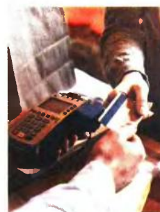
Το νέο μέτρο για τις e-δαπάνες θα εφαρμόζεται από φέτος έως και το 2025.

Με βάση τα όσα προβλέπονται στην κοινή υπουργική απόφαση, για την κάλυψη του 30% του ετήσιου εισοδήματος θα «μετράνε» εις διπλούν οι δαπάνες για πληρωμή αμοιβών σε άλλες οκτώ κατηγορίες επαγγελματιών: