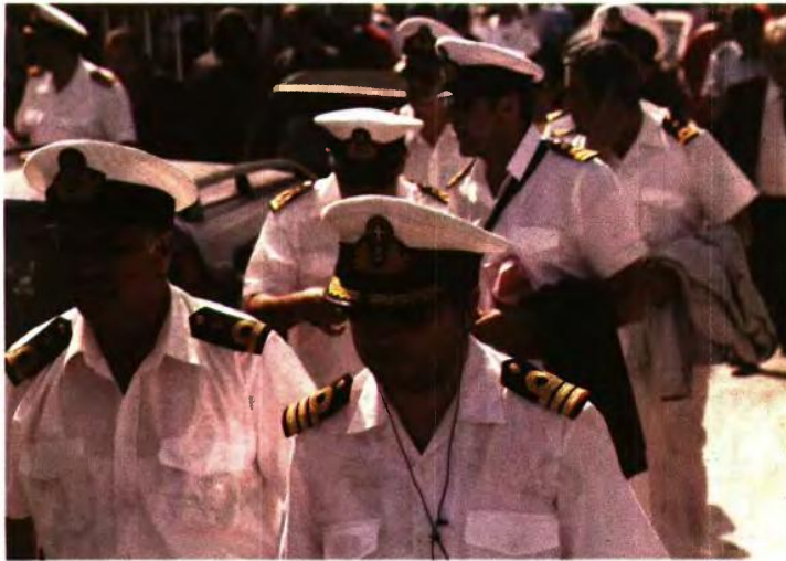
ΑΥΞΗΣΕΙΣ ΣΥΝΤΑΞΕΩΝ ΣΤΟΝ ΕΠΑΝΥΠΟΛΟΓΙΣΜΟ ΚΑΙ ΚΟΥΡΕΜΑ ΠΡΟΣΩΠΙΚΗΣ ΔΙΑΦΟΡΑΣ