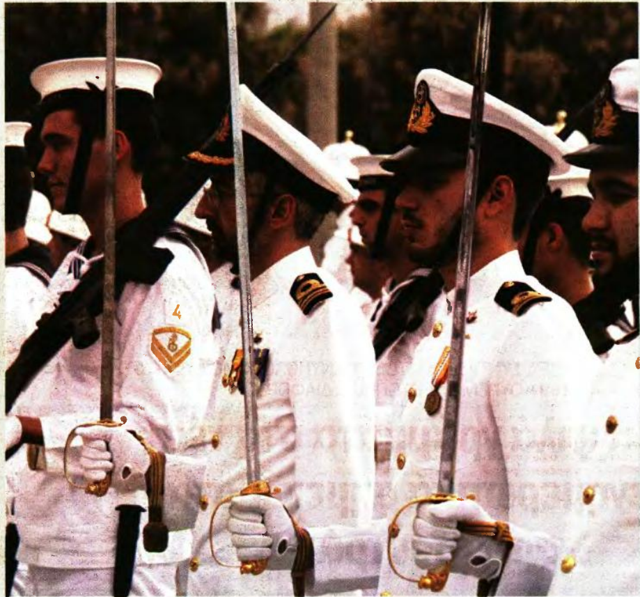
Οι αυξήσεις στις συντάξεις των ενστόλων, λόγω επιπλέον ετών παραμονής στην υπηρεσία

Σημειώνεται ότι οι μέχρι το 1992 ασφαλισμένοι που συμπληρώνουν 24,5 έτη (ήλπν της μάχης υπηρεσίας τους) ως το 2014 συνταξιοδοτούνται με συνολικό χρόνο 30,5 ετών υπηρεσίας, ενώ όσοι συμπληρώνουν τα 24,5 έτη (κυρίως νέοι από 1993 και μετά ασφαλισμένοι) από το 2015 και μετά βγαίνουν στη σύνταξη είτε με 40ετία χωρίς όριο ηλικίας είτε με τα ηλικιακά όρια που προβλέπονται για την αποστρατεία σε κάθε βαθμό με 35ετή υπηρεσία.