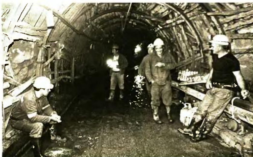
Τα ευνοϊκά όρια ηλικίας και προϋποθέσεις συνταξιοδότησης στα ΒΑΕ ισχύουν κυρίως στα μεταλλεία και στις στοές (υπερβαρέα), όπου οι μισθωτοί συνταξιοδοτούνται μεταξύ 52ου και 62ου έτους της ηλικίας τους

ΟΙ ΑΠΟΔΟΧΕΣ. Στο μεταξύ, τον κίνδυνο να έχουν και ονομαστικές απώλειες αποδοχών μετά τη συρρίκνωση του διαθέσιμου εισοδήματός τους λόγω ακρίβειας και πληθωριστικής έκρηξης αντιμετωπίζουν περίπου 25.000 εργαζόμενοι με σχέση εργασίας ιδιωτικού δικαίου στον δημόσιο τομέα. Αφορμή είναι το σχέδιο της κυβέρνησης για μερικό ή ολικό αποχαρκτηρισμό των ειδικοτήτων τους και την απένταξη αυτών από τα ΒΑΕ. Μάλιστα, για τις 10.000 εργαζομένους εξ αυτών ελλοχεύει ο κίνδυνος οριστικής κατάργησης τόσο του σχετικού επιδόματος όσο και του ειδικού ασφαλιστικού καθεστώτος των ΒΑΕ μέσω του οποίου συνταξιοδοτούνται στο 62ο έτος με 35 έτη ασφάλισης (εκ των οποίων τα 25 έτη σε καθεστώς βαρέων) και στο 60ό έτος με μείωση 12% επί της εθνικής σύνταξης (μείον 46 ευρώ τον μήνα).