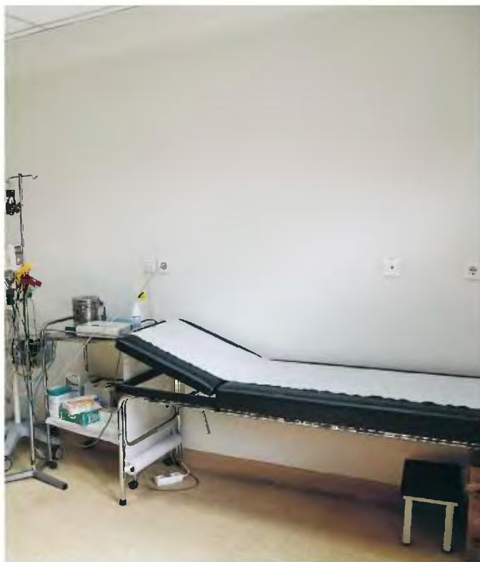
Στόχος είναι όλοι οι πολίτες να έχουν τον προσωπικό θεράποντα ιατρό τους, που θα παρακολουθεί την κατάσταση της υγείας τους και θα τους παραπέμψει σε γιατρούς άλλων ειδικοτήτων και σε νοσοκομεία.

Προσπάθειες για την εφαρμογή του θεσμού του οικογενειακού γιατρού που θα λειτουργεί ως «κθμός» για την πρόσβαση στο σύστημα υγείας, έχουν γίνει από το 2014 χωρίς επιτυχία. Σήμερα μόλις 1,4 εκατ. πολίτες είναι εγγεγραμμένοι σε οικογενειακό γιατρό. Ο ΕΟΠΥΥ έχει