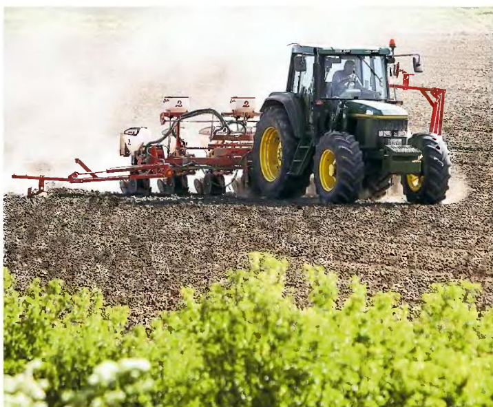
Μέχρι σήμερα η νομοθεσία περιορίζει τη δυνατότητα χρήσης έως 30 στρεμμάτων μόνο για αγροτική εκμετάλλευση.

Η σχετική ρύθμιση περιλαμβάνεται σε σχέδιο νόμου του υπουργείου Εσωτερικών που κατατέθηκε την Παρασκευή στη Βουλή. Οπως προβλέπει: • Το Δημόσιο δεν προβάλλει δικαίωμα κυριότητας σε δασωμένους αγρούς εφόσον δεν διαθέτει τίτλο ιδιοκτησίας. Μέχρι σήμερα το Δημόσιο δεν διεκδικούσε την κυριότητα των εκτάσεων αυτών μόνο εφόσον ιδιώτης προσκόμι-