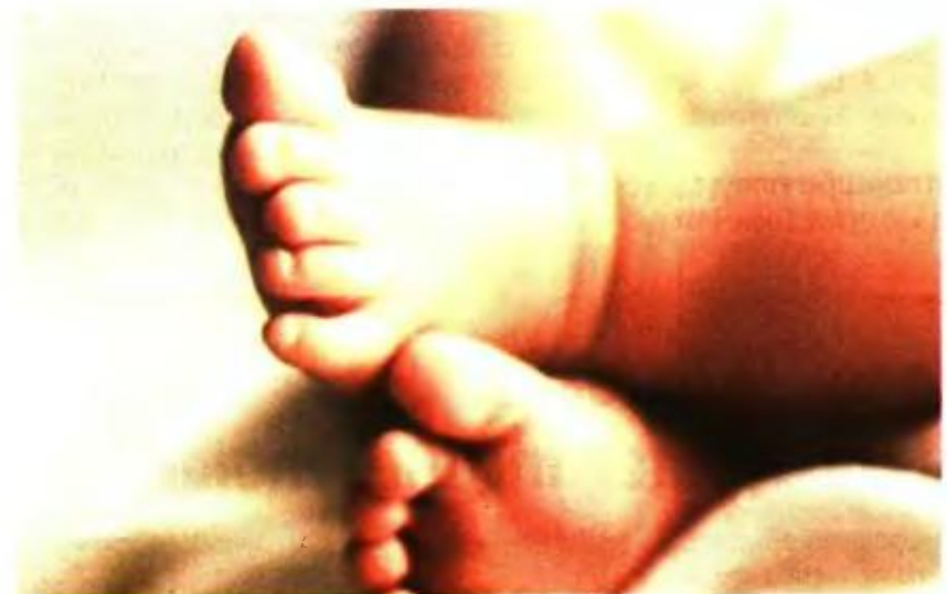
Το φαινόμενο θα συνεχισθεί και θα ενταθεί τις αμέσως επόμενες δεκαετίες

Αυτό οφείλεται, σύμφωνα με τους Β. Κοτζαμάνη και Β. Παππά, σε δύο κυρίως λόγους: 1)