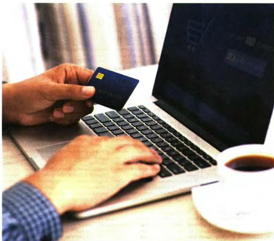
Υπάρχουν δώδεκα κατηγορίες φορολογουμένων που εξαιρούνται από την πληρωμή αγαθών και παροχής υπηρεσιών με ηλεκτρονικά μέσα.

6 Σε κάθε περίπτωση υποβολής κοινής δήλωσης από έγγαμους ή μέλη συμφώνων συμβίωσης (ΜΣΣ), που έχουν από κοινού εξαρτώμενα τέκνα με τουλάχιστον 67% αναπηρία τα οποία δεν υποβάλλουν ατομικές δηλώσεις, οι κωδικοί 005-006 του πίνακα 3 στους οποίους πρέπει να αναγραφεί ο αριθμός των τέκνων αυτών για την εξασφάλιση