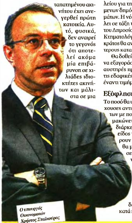
Ο υπουργός Οικονομικών Χρήστος Σταϊκούρας

2 Το ζήτημα απόνησε για κάποια χρόνια, για να επανέλθει στο προσκήνιο επί κυβέρνησης Κώστα Καραμανλή. Οι πρώτες πινελιές μπήκαν το 2005, αλλά το τελικό σχέδιο νόμου καταρτίστηκε το 2009 από τον τότε υπουργό Οικονομίας και Οικονομικών Γιάννη Παπαθανασίου. Ως τμήμα εξαγοράς λάμβανε την αντικειμενική αξία του