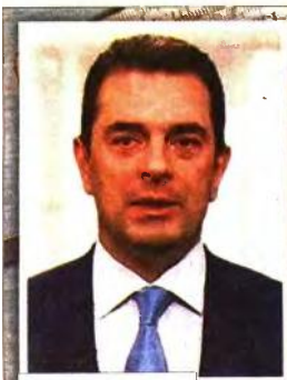
Ο Κώστας Σκρέκας