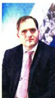
Μιλώντας στο συνέδριο της ΠΟΜΙΔΑ ο διοικητής της ΑΑΔΕ, Γιώργος Πιτσιλής, τόνισε ότι «έχει ξεκινήσει η προετοιμασία για διασύνδεση της βάσης δεδομένων της ΑΑΔΕ με το Κτηματολόγιο».