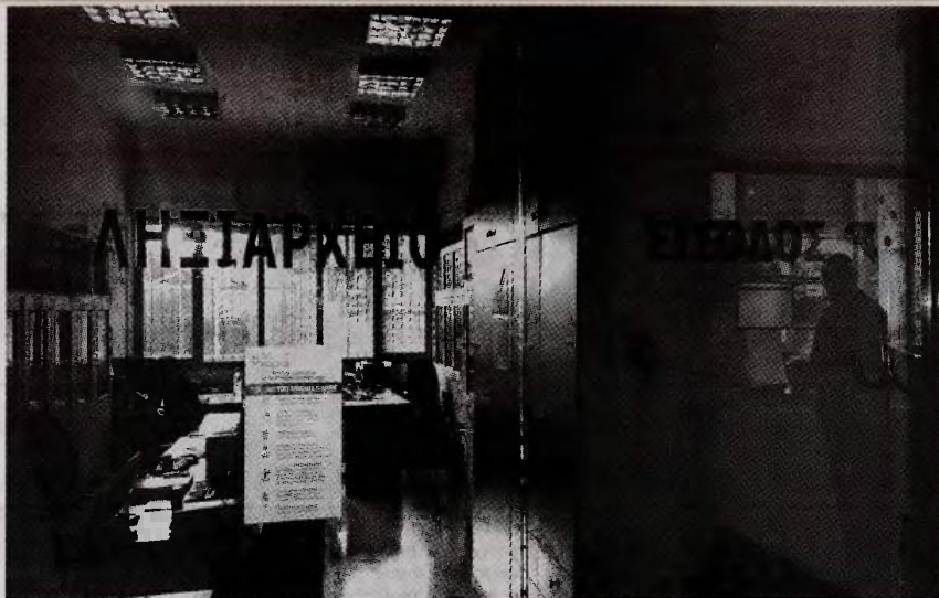
• Το δημαρχείο προτιμάται απ' την εκκλησία, κερδίζουν τις προτιμήσεις ζευγαριών τα σύμφωνα συμβίωσης

Απαραίτητη σημείωση: Οι γεννήσεις προέρχονται κατά τη συντριπτική τους πλειοψηφία απ' την Δημοτική Ενότητα Ρεθύμνης (1.172) κι αφορούν αυτές που έγιναν στο νοσοκο-