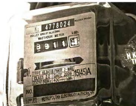
Επέκταση της επιδότησης στους λογαριασμούς ηλεκτρικού ρεύματος και φυσικού αερίου τον Φεβρουάριο

■ «Κουρεμένα» ενοίκια: Έως το τέλος του Φεβρουαρίου θα έχουν κλείσει οι εκκρεμότητες που υπάρχουν με τις αποζημιώσεις ιδιοκτητών και υπεκμισθωτών ακινήτων.