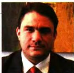
Του Κωνσταντίνου Τσουκαλά *

Μ ε την 1821/2021 απόφαση της, η Ολομέλεια του Ελεγκτικού Συνεδρίου έκρινε οριστικά και αμετάκλητα πλέον αντισυνταγματική την εισφορά αλληλεγγύης για την περίοδο από το 2011 έως το 2018.