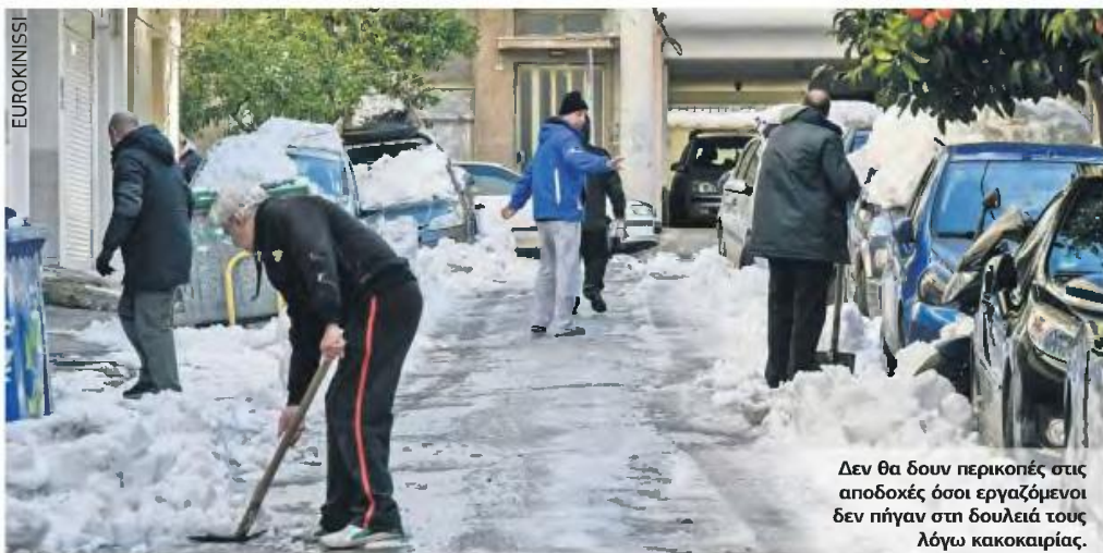
Δεν θα δουν περικοπές στις αποδοχές όσοι εργαζόμενοι δεν πήγαν στη δουλειά τους λόγω κακοκαιρίας.

Το κόστος εισφορών για το διήμερο της αργίας, σύμφωνα με τη ρύθμιση που προωθείται, θα αντιστοιχεί στα 2/25 των μηνιαίων εισφορών