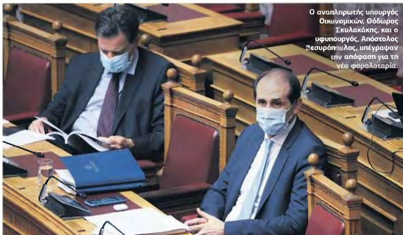
Ο αναπληρωτής υπουργός Οικονομικών, Θόδωρος Σκυλακάκης, και ο υφυπουργός, Απόστολος Βεαυρόπουλος, υπέγραψαν την απόφαση για τη νέα φορολογία.

επί του μηνιαίου εισοδήματος που καταναλώνεται με ηλεκτρονικά μέσα πληρωμής. ▶ Οι λαχοί κάθε συμμετέχοντα προσυζητούνται κατά 50% επί των υπολογιζόμενων σύμφωνα με τα ανωτέρω λογίζονται ένας (1) λαχός. ▶ Σε περίπτωση που το ποσό που καταναλώνεται με χρήση κάρτας ή άλλου ηλεκτρονικού μέσου πληρωμής μέσα στο μήνα αναφοράς υπερβαίνει το 30%, 50% ή 70% του μηνιαίου εισοδήματος, οι λαχοί διπλασιάζονται, τριπλασιάζονται ή τετραπλασιάζονται αντίστοιχα. Ως μηνιαίο εισόδημα νοείται το 1/12 του ετήσιου, ατομικού, πραγματικού καθαρού εισοδήματος, φορολογούμενου ή απαλλασσόμενου της υποβληθείσας δήλωσης φορολογίας εισοδήματος που είναι η τελευταία για την οποία έχει παρέλθει η προθεσμία υποβολής και δεν περιλαμβάνεται το εισόδημα που προκύπτει από την προστιθέμενη διαφορά τεκμηρίων. ▶ Πολίτες με ετήσιο, ατομικό, πραγματικό καθαρό εισόδημα, φορολογούμενο και απαλλασσόμενο, μικρότερο των 1.000 ευρώ, καθώς και μη υπόκεινται σε υποβολή δήλωσης φορολογίας εισοδήματος, απολαμβάνουν διπλάσιους λαχμούς για κάθε ευρώ που καταναλώνουν χωρίς την περαιτέρω προσαύξηση αναλόγως του ποσοστού