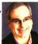
ΤΩΝ LAURA TYSON, LENNY MENDONCA

Εάν περνούσε το σχέδιο Μπάιντεν, θα πρόσθετε κρίσιμη υποστήριξη στις προσπάθειες της Καλιφόρνιας αυξάνοντας και διευρύνοντας την ομοσπονδιακή πίστωση φόρου για παιδιά, διασφαλίζοντας ότι καμία εργαζόμενη οικογένεια με κέρδη κάτω των $300.000 δεν θα ξόδευε περισσότερο από το 7% του εισοδήματός της στη φροντίδα των παιδιών και παρέχοντας έως και τέσσερις εβδομάδες γονικής άδειας μετ' αποδοχών τόσο για μισθωτούς όσο και για αυτοαπασχολούμενους.