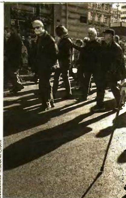
ΕΥΡΟΚΙΝΗΣΗ / ΓΑΛΙΑΝΑ ΜΠΟΥΡΑΦΗ

Ο υφυπουργός Εργασίας Πάνος Τσακλόγλου διαβεβαίωσε ότι δεν πρόκειται να υπάρξουν περικοπές