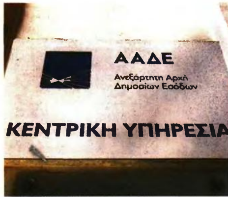
Σύμφωνα με την εγκύκλιο της ΑΑΔΕ, το νέο καθεστώς θα ισχύσει για τα φορολογικά έτη 2022 έως και 2025.

Ποιες ομάδες αφορά θα πρέπει να αναφερθεί ότι οι δαπάνες απόκτησης αγαθών και λήψης υπηρεσιών για τις οποίες ισχύει το εν λόγω bonus, εφόσον πραγματοποιηθούν με ηλεκτρονικά μέσα πληρωμής,