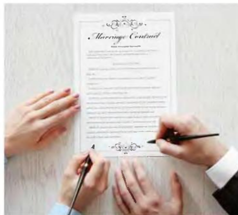
Το 2021 στον Δήμο Χανίων πραγματοποιήθηκαν τετρακόσιοι τριάντα πέντε γάμοι, 23% περισσότεροι από το 2020, και υπεγράφησαν διακόσια τριάντα ένα σύμφωνα συμβίωσης, υπερδιπλασιασμένα (+52%) σε σχέση με πέρυσι.