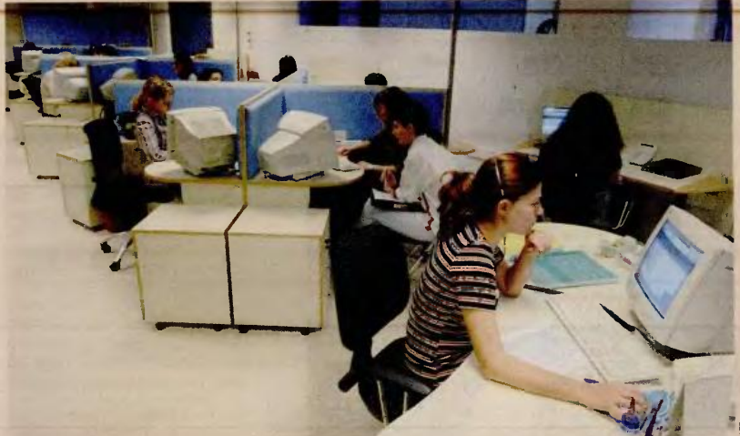
Υποχρεωτικός εμβολιασμός, συνεχή διαγνωστικά τεστ, πρόστιμα αλλά και ασθένειες των ιδίων των εργαζομένων ή μελών της οικογένειάς τους, τηλεργασία, ευέλικτα ωράρια και επαγγελματικοί κίνδυνοι είναι μόνο κάποια από τα θέματα που ανοίγουν και τα οποία ενδέχεται να διαμορφώσουν νέα δεδομένα στην ισχύουσα νομολογία.

Οι άδειες αυτές λειτουργούν παράλληλα με τις ειδικά προβλεπόμενες στην έκτακτη νομοθεσία λόγω COVID-19, όπως για παράδειγμα η άδεια καραντίνας και η άδεια νόσησης τέκνου. • Άδεια φροντιστή: Χορηγείται σε εργαζόμενο με προϋπηρεσία έξι μηνών, έχει διάρκεια έως πέντε εργάσιμες ημέρες, μπορεί να χορηγηθεί τμηματικά ή άπαξ και αφορά πρόσωπο που αντιμετωπίζει σοβαρό ιατρικό λόγο που μπορεί να είναι η νόσηση από COVID-19. Η άδεια αυτή είναι άνευ αποδοχών. Η χορήγησή της μπορεί να προστεθεί και να επεκτείνεται την άδεια νόσησης τέκνου από COVID-19, η οποία είναι μετ' αποδοχών και διαρκεί επτά ή δεκατέσσερις ημέρες.