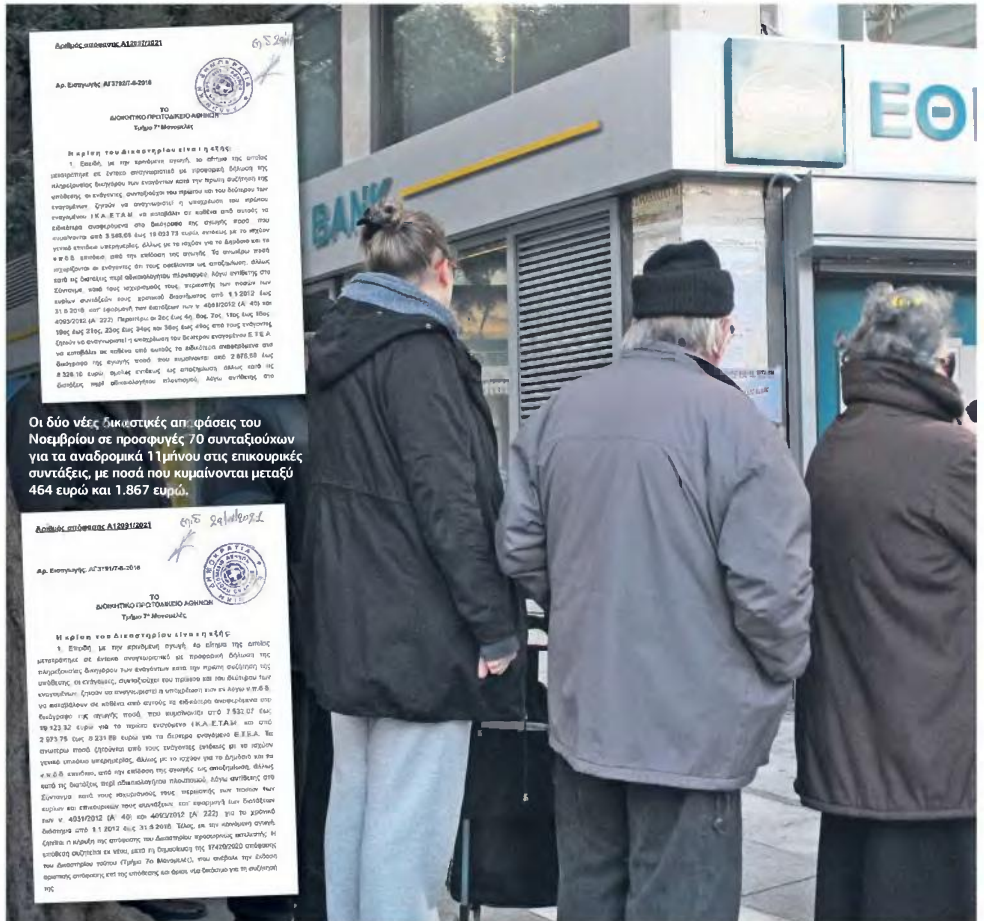
Οι δύο νέες δικαστικές αποφάσεις του Νοεμβρίου σε προσφυγές 70 συνταξιούχων για τα αναδρομικά 11μήνου στις επικουρικές συντάξεις, με ποσά που κυμαίνονται μεταξύ 464 ευρώ και 1.867 ευρώ.

Η υπέρβαση της απόφασης συνίσταται στο γεγονός ότι το δικασμόν δικαστήριο αποφαιίνεται πως με το άρθρο 96 του νόμου 4387/2016 θεσπίστηκαν με ρητή διάταξη μόνον ο επανυπολογισμός και η περικοπή των επικουρικών συντάξεων, ενώ θα έπρεπε να υπάρχει και ανάλογη ρητή διάταξη για τα Δώρα, μια που μετά την αντισυνταγματική κατάργησή τους θα έπρεπε να αναβιώσει αυτόματα το προϊσχύον καθεστώς (άρθρο 65 του ν. 2084/1992 και άρθρο 28 του ν. 4476/1965), δηλαδή η επαναφορά των Δώρων. Το γεγονός ότι δεν υπάρχει ρητή διάταξη που να ορίζει ότι τα Δώρα δεν επανέρχονται μετά το νόμο Κατρούγκαλου, θεωρήθηκε άξιο έρευνας από το ΣτΕ, που θα δώσει και την τελική απόφαση.